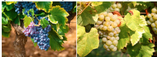
• Vignobles de Monbazillac (Bergerac) •