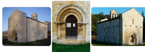
• Chapelle prieurale Saint-Thomas de Tresséroux - 24400 Les Lèches | XIIe-XIIIe s. •