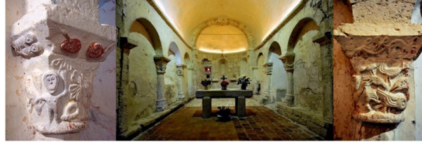
• Église Saint-Pierre de Monbos - 24240 Thénac (Sigoulès) | XIe-XIIe s. •