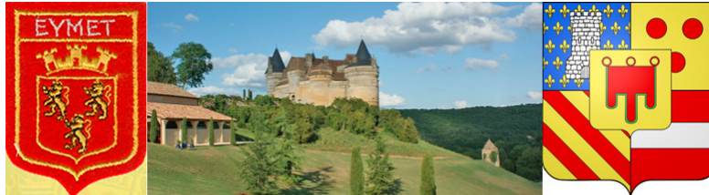
• Blason d'Eymet | Château de Bannes - 24440 Beaumont-du-Périgord (XIVe s.) | Blason de Beaumont-du-Périgord •