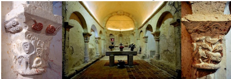
• Église Saint-Pierre de Monbos - 24240 Thénac | XIe-XIIe s. •