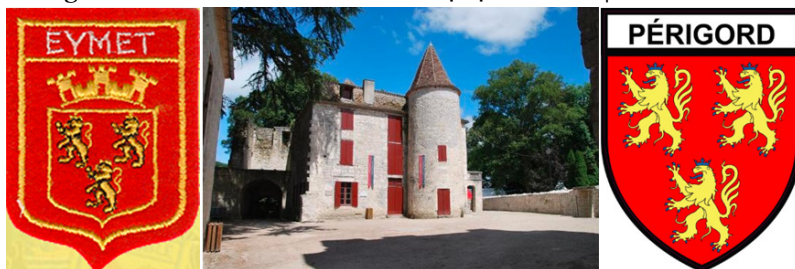
• Blason d'Eymet | Château d'Eymet (XIIIe-XIVe s.) | Blason du Périgord •