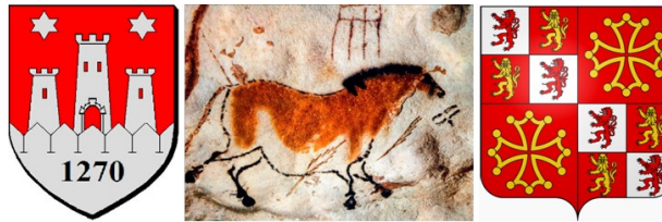
• Blason d'Eymet | Lascaux - 24290 Montignac | Blason occitan •

✧ Bienvenue | Benvençuts | Welcome | Willkommen | Benvenuto | Bienvenidos ✧