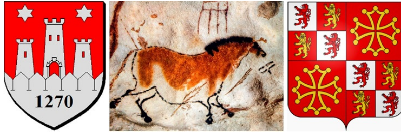
• Blason d'Eymet | Lascaux - 24290 Montignac | Blason occitan •

• Préhistoire | Histoire | Avenir culturel | Réflexions pluridisciplinaires •