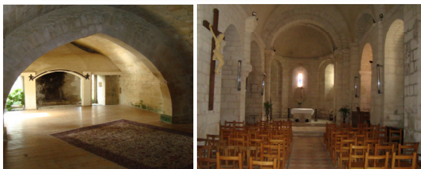
✧ Château de Monteton (XIIe s.) • Église Notre-Dame de Monteton (XIIe s.) ✧